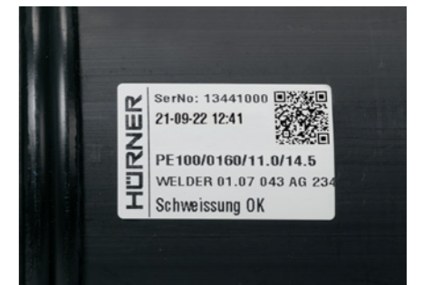
Etikettendrucker und Etikett

Zur direkten Qualitätsmarkierung für jede Schweißnaht kann mit einem speziellen, optionalen Etikettendrucker eine abriebfeste Kunststoffolie zur Formteilkennzeichnung bedruckt werden.