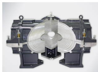
Spannwerkzeug T- / X-Stück