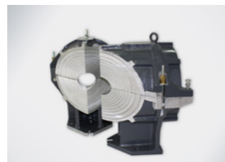
Spannwerkzeug Y-Stück (60°)