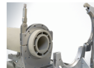
Schnellspannverschluss für Aluminium-Grundspannbacken, optional erhältlich.