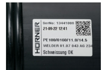
Etikettendrucker und Etikett

Zur direkten Qualitätsmarkierung für jede Schweißnaht kann mit einem speziellen, optionalen Etikettendrucker eine abriebfeste Kunststoffolie zur Formteilkennzeichnung bedruckt werden.