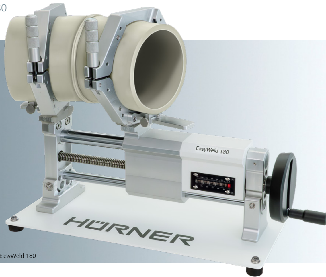
Abbildung: HÜRNER EasyWeld 180