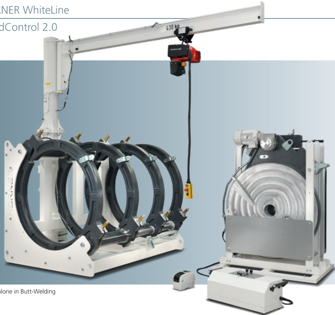
Stand-alone in Butt-Welding