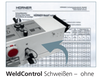
WeldControl Schweißen – ohne Fehler, ohne Schweißtafel und mit Protokollierung