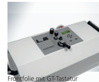
Frontfolie mit GT-Tastatur