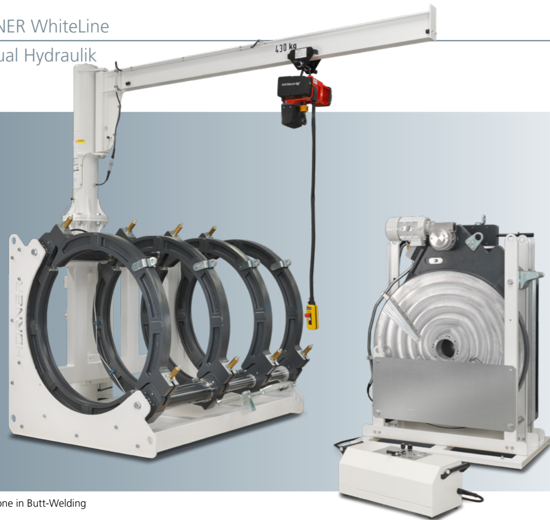
Stand-alone in Butt-Welding