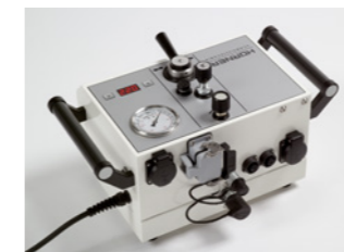
Alle Anschlüsse auf der Gehäuserückseite