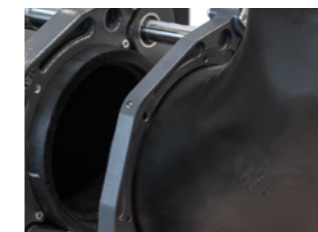
Industrierausführung – Optional sind die Grundmaschinen (250, 315, 355, 500, 630) auch in Industrierausführung mit modifizierter 3. Spannbacke zum Spannen von kurzschenkligigen Formstücken erhältlich. 2)