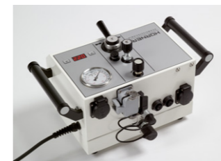
Alle Anschlüsse auf der Gehäuserückseite