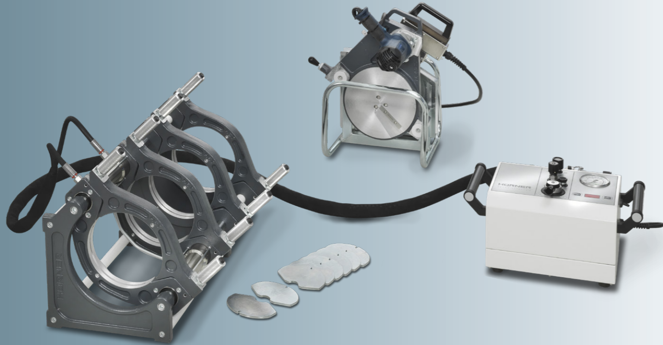
Stand-alone in Butt-Welding