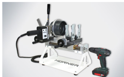
Antriebsmaschine Akku-Schrauber/ Bohrmaschine optional