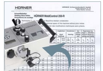
WeldControl Schweißen – ohne Fehler, ohne Schweißtabelle und mit Protokollierung