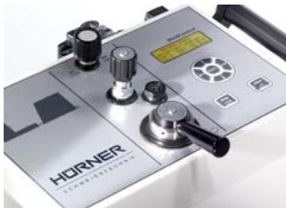
Frontfolie mit GT-Tastatur